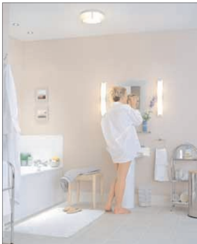
Viel Licht im Raum: Badezimmer sollten hell gestaltet und mit ausreichend Beleuchtung versehen sein.

In jedem Fall gilt: Sprechen Sie unsere Fachbetriebe auf diesen Seiten an – denn kompetente Beratung und Erfüllung der Badträume von der Planung bis zur Ausführung bieten unsere Experten hier vor Ort aus einer Hand. ■ fa