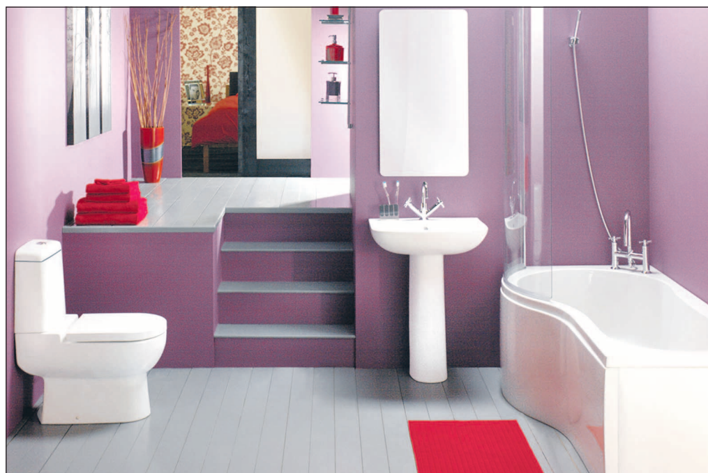
Es muss nicht gleich rosa sein, aber Gestaltungsmöglichkeiten gibts im Bad zu genüge – wer wissen will, wie es geht und was möglich ist, kann sich an einen der Fachbetriebe wenden.

Farbe: Diese Entscheidung ist wichtig. Von Ihrem Geschmack abhängig, doch auch davon, wie groß und hell der Raum ist. Je kleiner und dunkler der Raum für das Bad ist, desto strahlender und heller sollten die Farben sein. Achten Sie darauf, dass Sie für einen kleinen Raum nicht zu viele Farben auswählen. Die Verwendung einer einzigen Farbe kann den Raum größer wirken lassen.