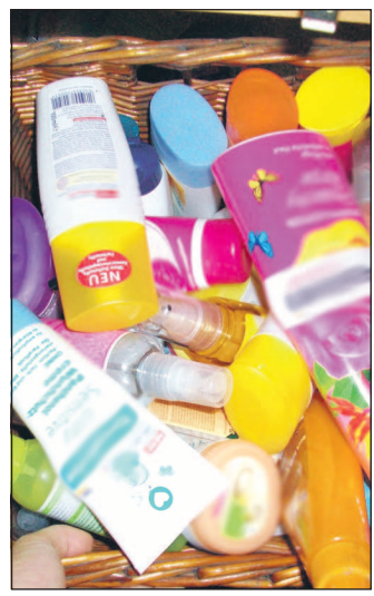
Nach der Badsanierung kann man sich mit diesen Waren erholsame Stunden gönnen.

Acryl bzw. Sanitäracryl lässt sich beliebig, vor allem aber körpergerecht formen. Das stabile, hochbelastbare Material kann in nahezu allen Farben hergestellt werden. Bade- und Duschwannen aus gegossenem, voll durchgefärbtem Acryl sind lichtbeständig und weisen selbst nach langer Nutzung keine Farbänderungen auf. Durch die wärme- und schalldämmenden Eigenschaften werden keine zusätzlichen Dämmstoffe benötigt. Neue Techniken ermöglichen um-