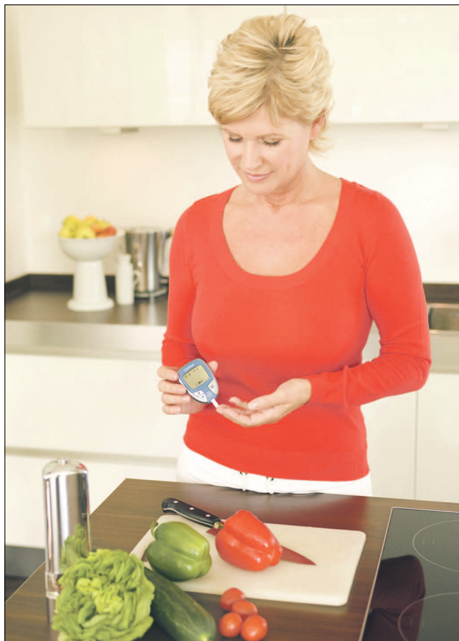
Gesundes Essen ist mit das A und O bei einer Diabetes-Erkrankung. Außerdem gehört regelmäßiges Messen des Blutzuckers zum täglichen Programm eines Diabetikers. Wie auf diesem Bild zu sehen ist, hat die Frau ein Messgerät dabei und achtet auf ihre Ernährung. Bei einer diagnostizierten Diabetes-Erkrankung ist eine Umstellung der Ernährung nahezu unerlässlich. ■

Süderländer Tageblatt Überregionale Heimatzeitung · Plettenberger Zeitung · Haveländer Nachrichten · Seit 1888