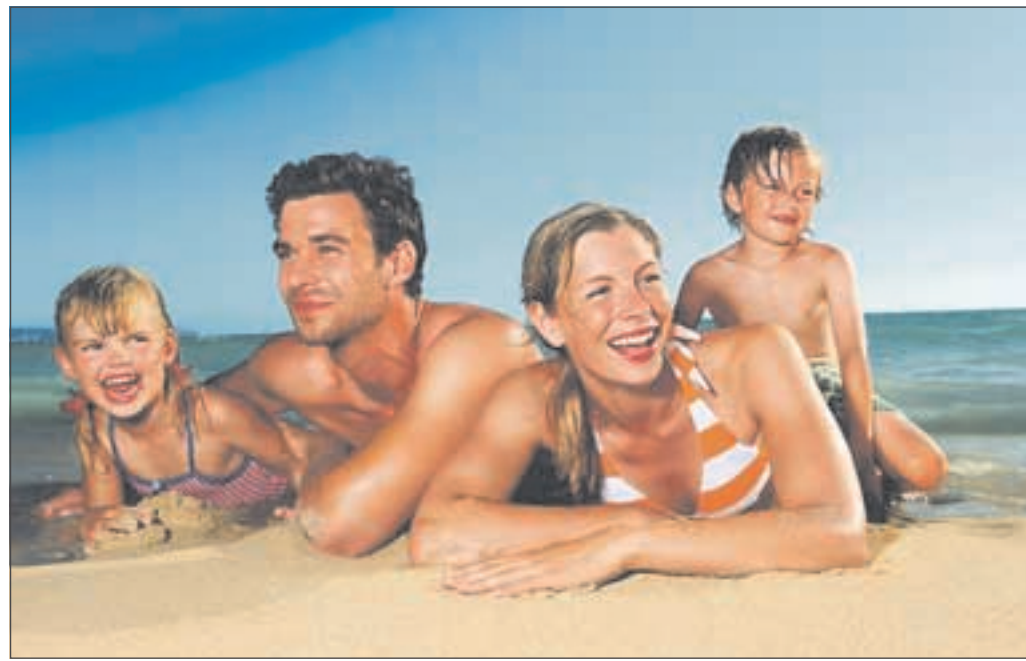
Früh buchen lohnt sich vor allem für Familien. ■ Foto: Rewe Touristik / ITS